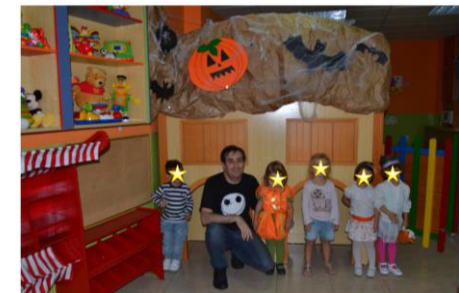
Nuestros profesores preparando actividades. Fiesta de HALLOWEEN y jornadas de Convivencia Camp Valverde 2014