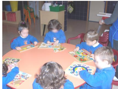
Alumnos de nuestro centro durante su etapa Infantil haciendo actividades.

Nuestro CLUB DE INGLÉS se basa en la preparación de las destrezas necesarias para dominar el lenguaje, ya sea hablado o escrito. De esta forma se incentiva a los alumnos a que utilicen y hablen en inglés durante las actividades de la clase, adquiriendo cada vez más práctica, habilidad y confianza.